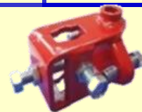
写真はユニバーサルヒッチ72

汎用管理機(リアロー列無し)に装着する場合には、作業機取付ヒッチ「ユニバーサルヒッチ72」もしくは「ユニバーサルヒッチ92」が必要です。本機ヒッチの内側高さをお確かめになってお買い求め下さい。