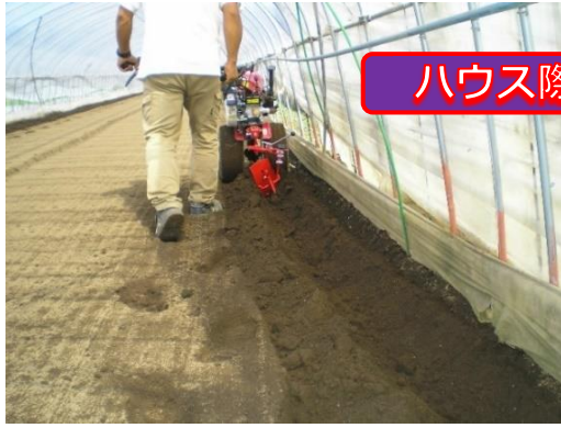
ハウス際の土寄せ作業に!!